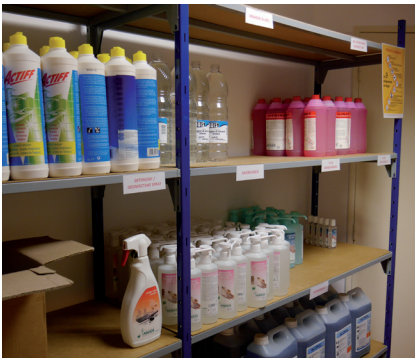
Produits adaptés au milieu hospitalier

Leur travail est capital : en plus de garantir un environnement propre et sain à l'hôpital, il participe à la confiance que les patients accordent à l'établissement