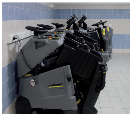
autolaveuses (hospi net)

L'entretien des locaux, le brancardage des patients et les courses sont trois activités indispensables au fonctionnement quotidien d'un établissement de santé