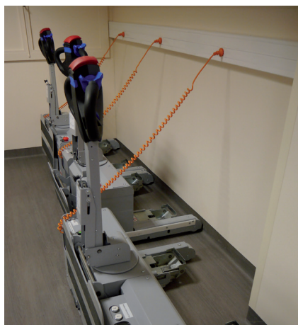
Tracteurs de lits (hospi mouv)