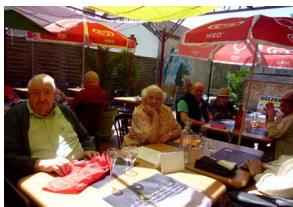
Sortie annuelle au restaurant Résidence Cardinal de Loménie