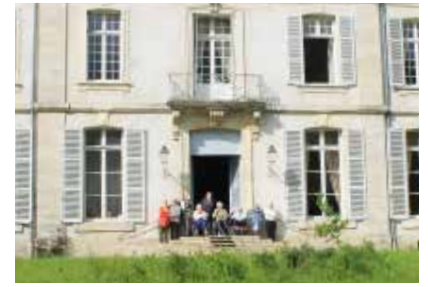
Voyage au Château de Pothières CH de Troyes - Domaine de Nazareth