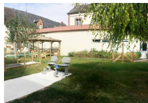
Parcours de santé afin d'accroître l'activité motrice GHAM - Site de Sézanne