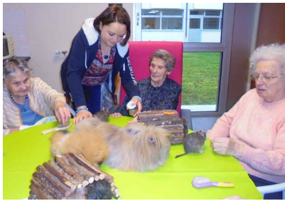
Séance de zoothérapie CH Saint Nicolas de Bar-sur-Aube