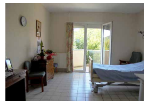
Chambres spacieuses et lumineuses CH de Bar-sur-Aube