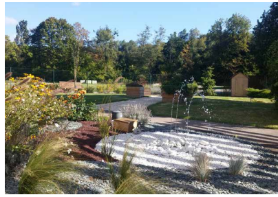
Jardin thérapeutique pour cultiver sa mémoire CH de Bar-sur-Seine