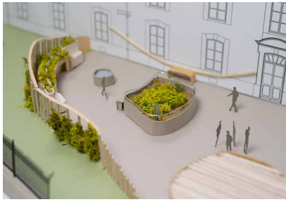
Terrasse conviviale avec jardin surélevé et activités sensorielles GHAM - Site de Nogent-sur-Seine En projet