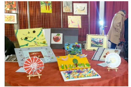
Exposition annuelle des créations artistiques des résidents en vente lors du marché de Noël CH de Troyes - Domaine de Nazareth