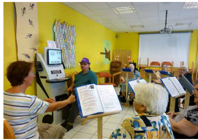
Borne musicale en libre accès avec de nombreux jeux autour de la musique pour enrichir sa mémoire Résidence Cardinal de Loménie